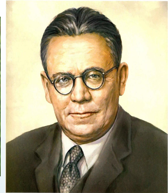
Самуил Яковлевич Маршак