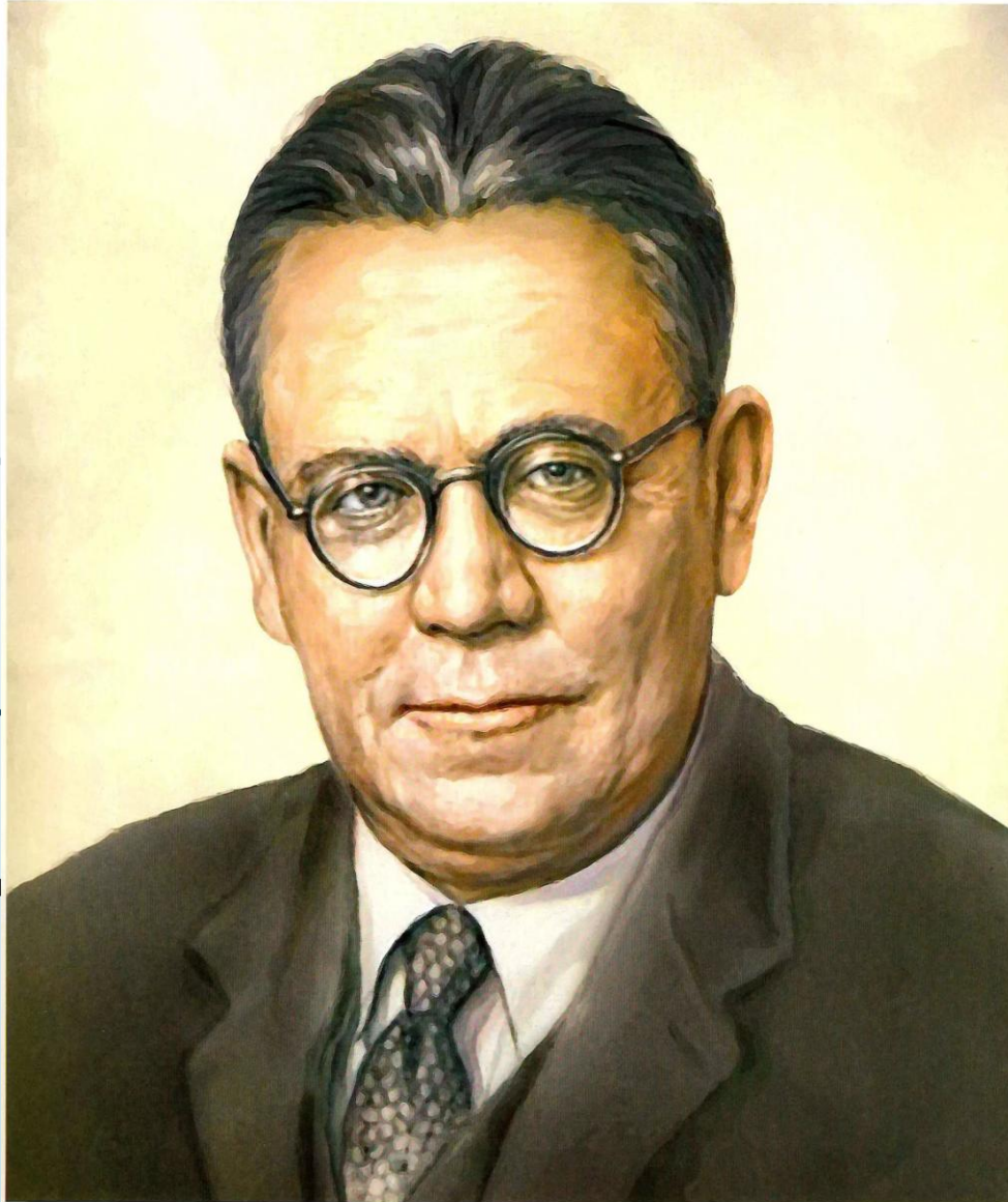
САМУИЛ ЯКОВЛЕВИЧ МАРШАК